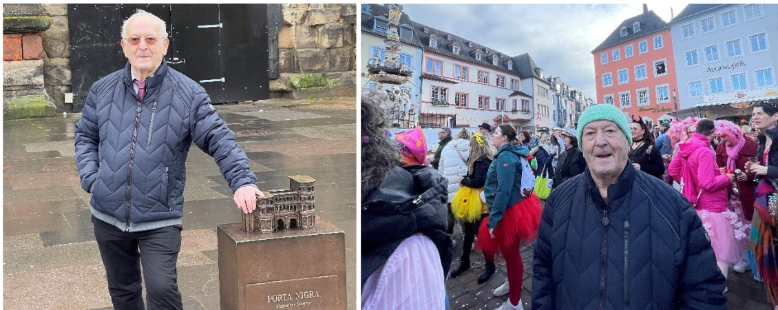
Stadtbesichtigung und buntes Treiben in Trier

Am Vormittag habe ich mich dann ausgeruht und am Nachmittag einen Spaziergang durch die Fußgängerzone durch Trier unternommen und dort auch dem Faschingstreiben zugeschaut.