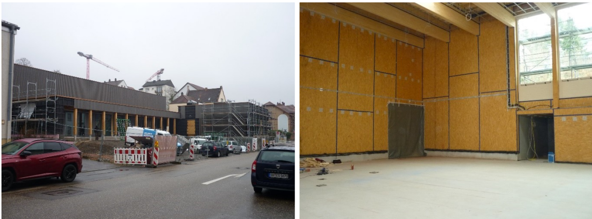
Neues Sporthallen Projekt in Pirmasens

Auf der Reise Richtung Luxemburg habe ich die Sporthalle Pirmasens besucht, ein neuer großer Auftrag für KBH. Dort habe ich die Situation aufgenommen, Bilder gemacht und einen Bericht für die Geschäftsleitung in Haiterbach erstellt.