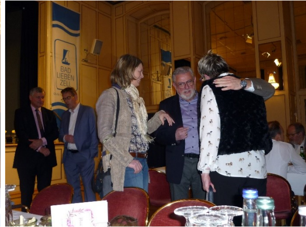
Veranstaltung in Bad Liebenzell mit hochrangigen Gästen